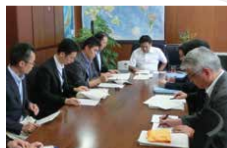
農林水産省 事務方と打合せをする様子

中央省庁等改革基本法(2001年施行)により、政務次官を廃止する代わりに、副大臣とともに中央省庁に置かれることになった役職です。大臣を助け、国会との交渉や特定の政策と企画に参画して政務を担当する特別職です。