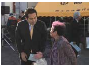
[行田市] 南河原ふれあい祭り