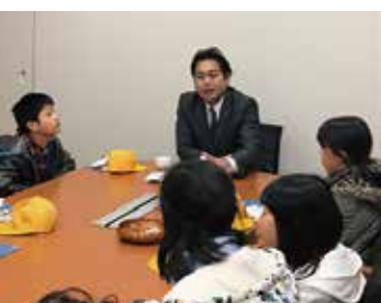
[加須市] 小学生皆さんと国会で対談