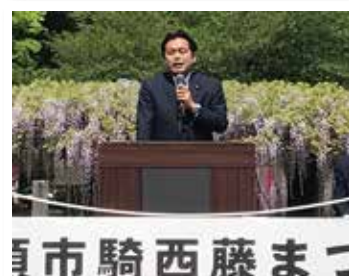
[騎西地域] 藤まつり