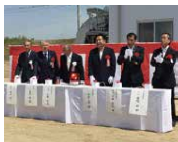
[妻沼地域] 秦土地改良区川成揚水機場通水式