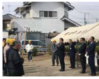
肥塚雀宮防災訓練