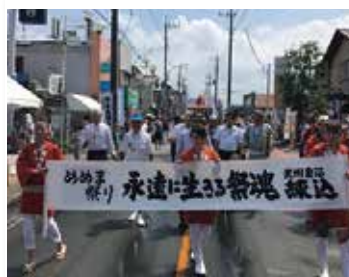
[妻沼地域] めぬま祭り