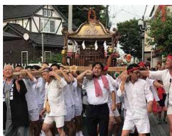
[加須市] かそどんとこい祭り