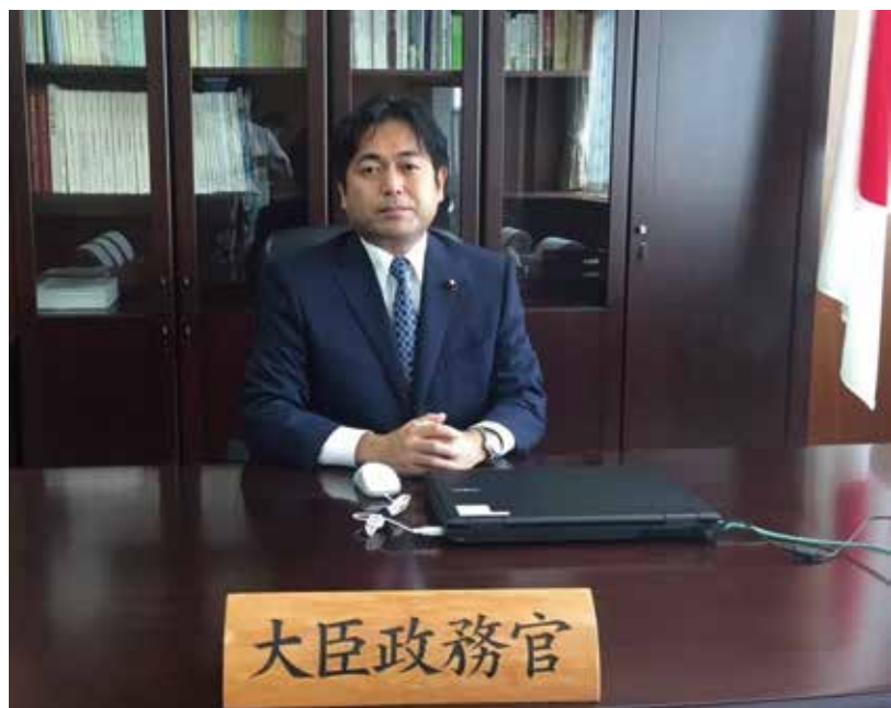
辞令交付後、初登庁。政務官室にて