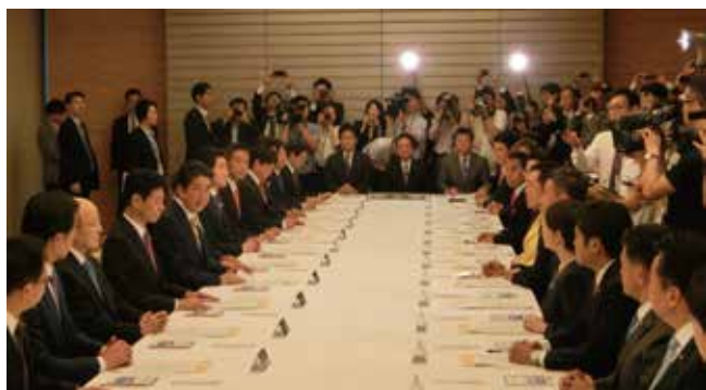
辞令交付後、初の大任政務官会議 安倍総理あいさつ