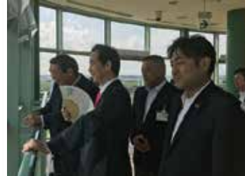
[行田市] 山本地方創生担当大臣（当時） 田んぼアート視察