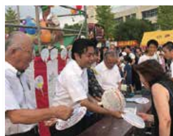
[北川辺地域] 商工会サマーフェスタ

昭和51年11月17日生まれ《40歳》 慶応大学卒業、建設会社勤務、県議会議員（2期） 平成24年衆議院選挙初当選 平成26年衆議院選挙2期目当選 【これまでの党役職】 国会対策委員会副委員長、青年局次長 経済産業部会副会長、内閣部会副会長