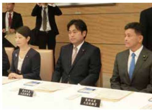
辞令交付後、初の大任政務官会議