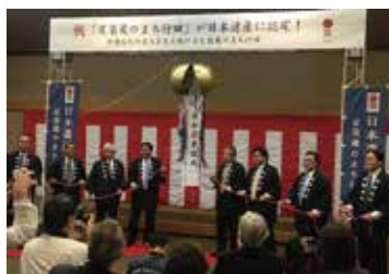
[行田市] 足袋蔵 日本遺産認定記念セミナー