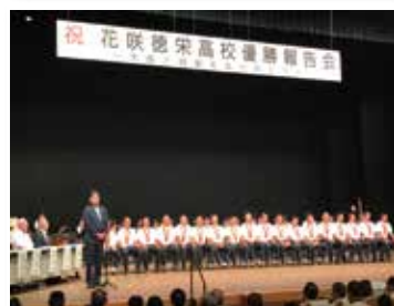
[加須市] 花咲徳栄高校野球部 第99回野球選手権全国大会優勝報告会