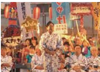
[行田市] 市民祭 行田浮城まつり式典