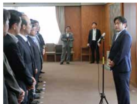
農林水産省幹部の方々に政務官就任あいさつ