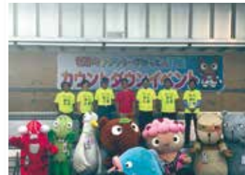
[羽生市] 世界キャラクターさみっと