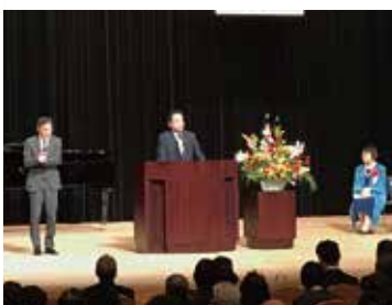
熊谷市表彰式 大里生涯学習センター「あすなつと」