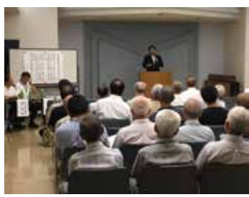
[妻沼地域] ミニ集会