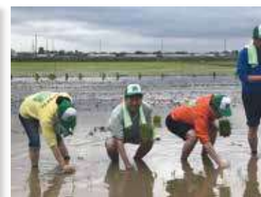
農業は国の基です。 田植えから収穫へ