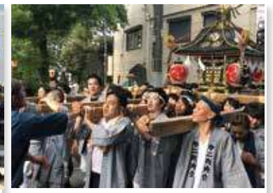
加須どんとこい祭り