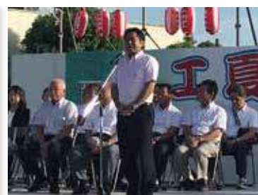
おとね商工夏祭り