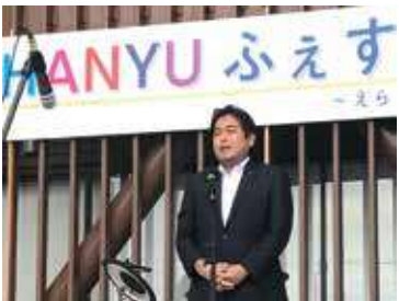
羽生フェスの日だ！