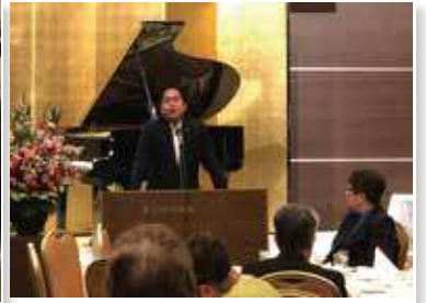
認定NPO法人くまがや小麦の会総会