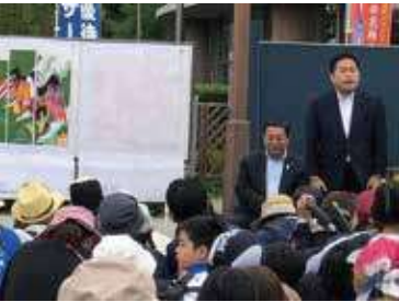
田んぼアート田植え