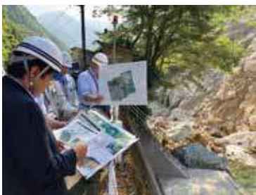
自然災害の被災現場へ