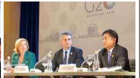
G20副議長として会議をリード

昭和51年11月17日生まれ《41歳》 慶応大学卒業、建設会社勤務、県議会議員(2期) 平成24年衆議院選挙初当選 平成29年衆議院選挙3期目当選 【これまでの党役職】 国会対策委員会副委員長、青年局長 経済産業部会副会長、内閣部会副会長