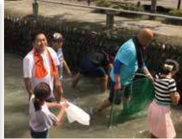
あつしぞ熊谷打ち水大作戦