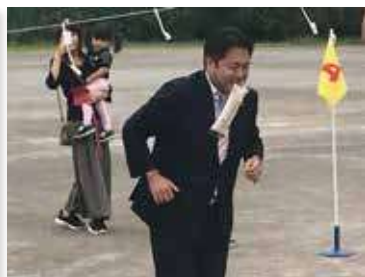
今年の多くの体育祭に出席