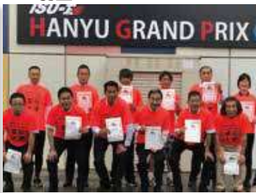
世界キャラクターサミット宣伝大使就任式