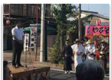
佐間天神社八坂祭り