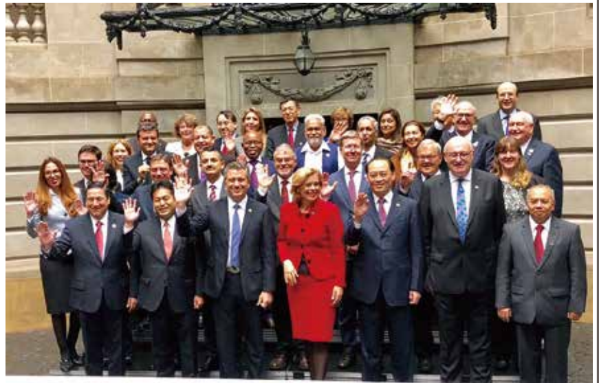
MEETING OF AGRICULTURE MINISTERS 27-28 July, Buenos Aires G20 ARGENTINA 2018

議長国のアルゼンチンにて、G20農業大臣会合に副議長国として出席しました。世界のGDPの合計の8割以上を占めるG20は、世界の経済成長と繁栄のために大きな役割を果たしています。来年は日本が議長国となり新潟で開催されます。