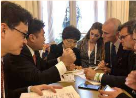
イタリヤ チエンティナイイオ農林政策大臣