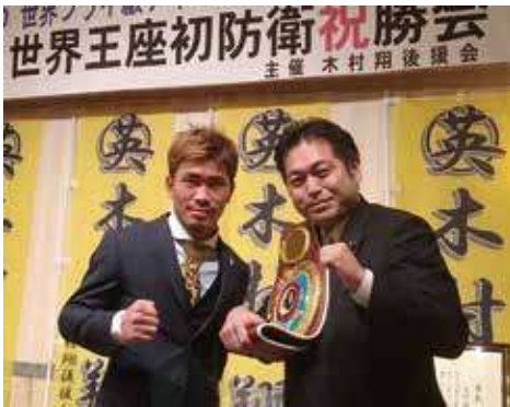
WBO 世界フライ級チャンピオン木村翔選手と