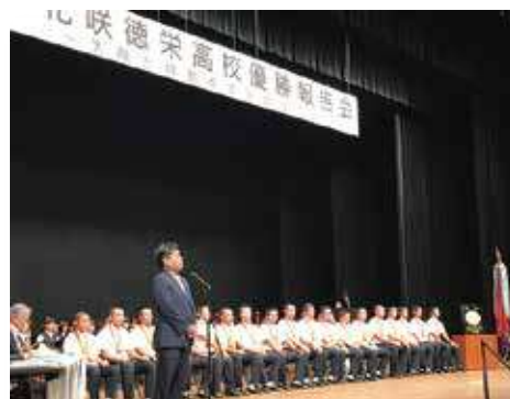
第99回全国高校野球選手権大会 花咲徳栄高校優勝報告会