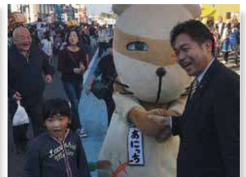
羽生市商工まつり