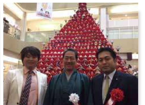
太鼓祭in鴻巣びっくりひな祭り