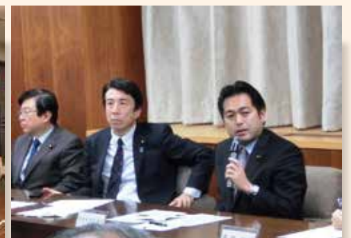
漁業取締本部第1回会合開催