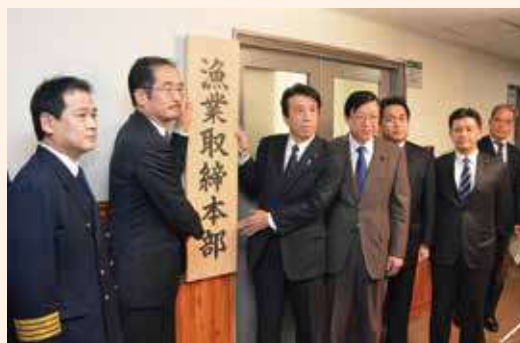
水産庁長官を本部長とする「漁業取締本部」を設置