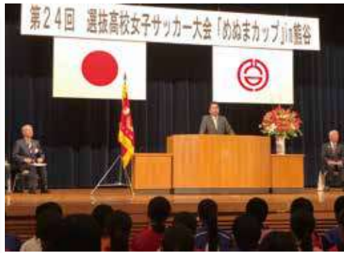
第24回選抜高校女子サッカー大会 「めめまカップ」in 熊谷