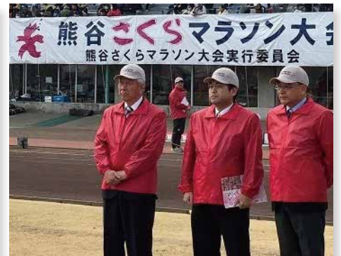
さくらマラソン大会にて 小林哲也埼玉県議会前議長と (右)