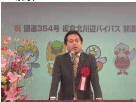
国道354号板倉北川辺バイパス開通式