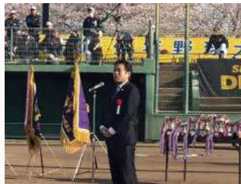
行田市少年野球春季大会