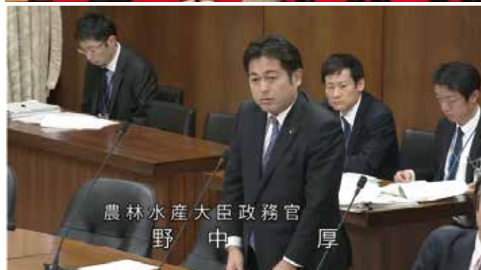
政務官として委員会で答弁