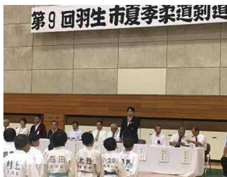
第9回羽生市夏季柔道剣道大会