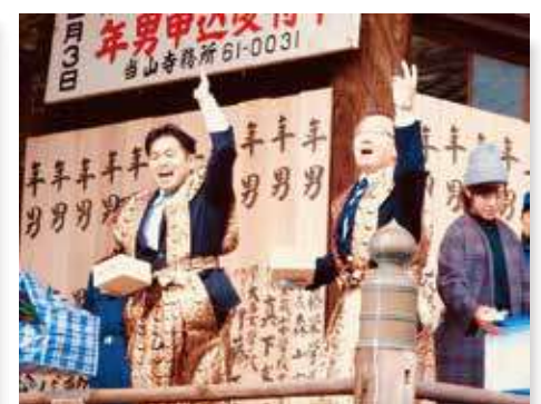
不動ヶ岡不動尊總願寺 節分会