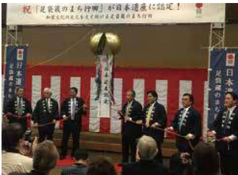
「足袋蔵のまち行田」 日本遺産認定セレモニー