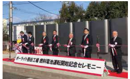
ポーライト株式会社。燃料電池をベース電源にする日本初の試みです。「ものづくり」で世界に挑戦し続ける中小企業を応援してまいります。