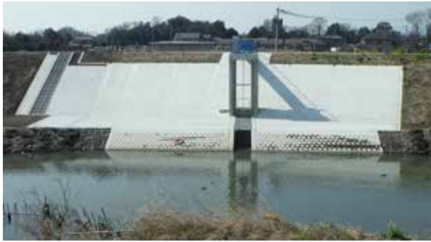
福川から見た川成揚水機全景と堤外護岸