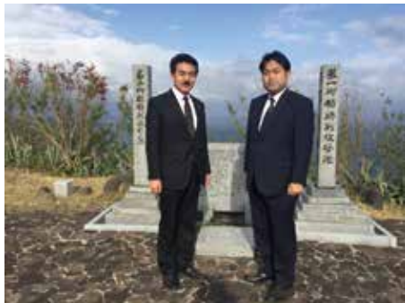
日米硫黄島戦没者合同慰霊追悼顕彰式に出席

地域の方々から、「何故、津田新田地域の堤防は整備されないのか？」と、地域の声をいただきました。早速、国土交通省に地域の声を届け、堤防整備が実現しました。