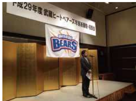
県民球団武蔵ヒートベアーズの出陣式に出席